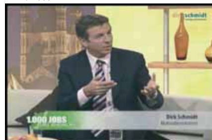
CENTERTV / 2008