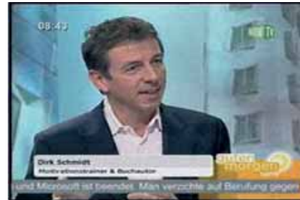
NRW-TV / 2007