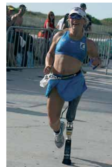
Sarah Reinertsen bei der Teilnahme des Ironman 2005 auf Hawaii. Trotz Beinprothese erreichte sie das Ziel in einer unglaublichen Zeit von 15 Stunden, 15 Minuten.