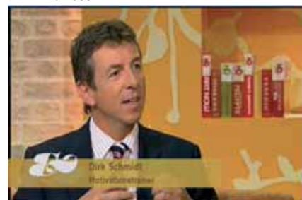
WDR / 2009