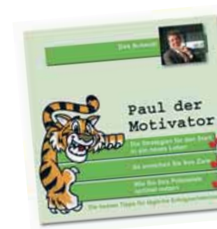
„Paul der Motivator“: EUR 17,95 ISBN: 978-3-8368-0374-8

» Paul der Motivator « gibt uns motivierende Strategien und Methoden an die Hand. Erprobte Tipps und witzige Zitate helfen privat und beruflich. Nutzen Sie die Kraft des Tigers für sich und geben Sie Ihrem Leben eine neue Qualität!