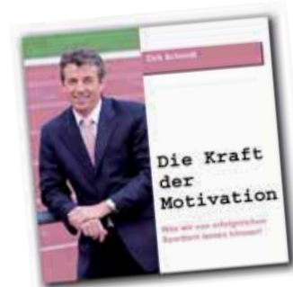
„Die Kraft der Motivation“: EUR 19,95 ISBN: 978-3-8368-0484-4