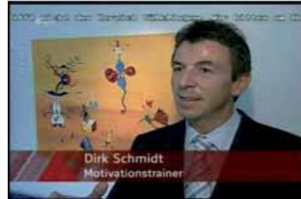
WDR / 2005