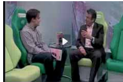
HALBZEIT / 2009