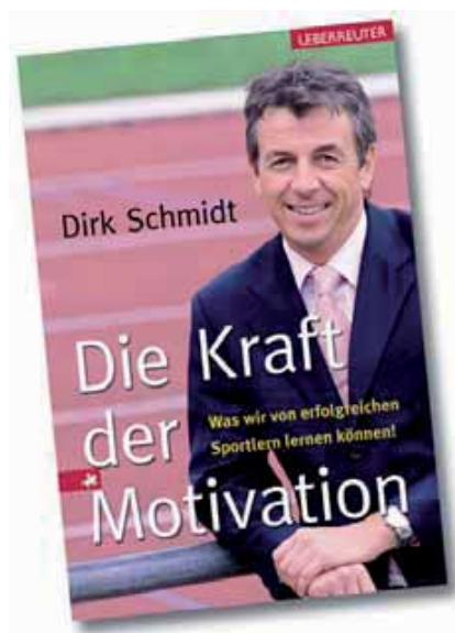
„Die Kraft der Motivation“: EUR 24,95 ISBN: 978-3-8000-7407-5

All das Wissen und die Erfahrung dieser Zusammenarbeit sind in sein neues Buch eingeflossen: » Die Kraft der Motivation « überträgt die Besonderheiten erfolgreicher Sportler – Beharrlichkeit, Kontinuität, Leidenschaft, zielorientiertes Handeln, klare Einstellung und klare Strukturen – auf unseren Alltag. Damit Sie von den Besten lernen können, um das Beste aus Ihrem Leben zu machen!