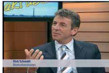
CENTERTV / 2008