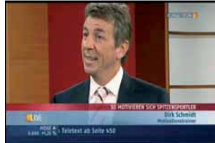
N24 / 2009