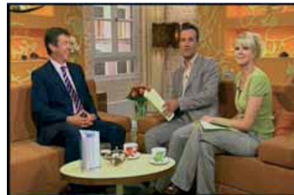
WDR / 2009