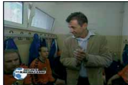
KABEL1 / 2005