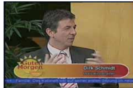
NRW-TV / 2009